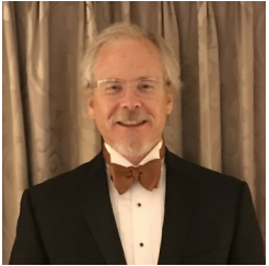
Paul Erlendson Callan LLC

The Retirement Trust was established by the City of El Paso to provide participants retirement benefits. It is regulated by the El Paso Municipal Code and administered by the Board of Trustees “the Board”. The Board administers the Retirement Trust and, with the guidance of investment